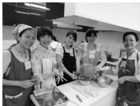
ふらっとステーションとつか