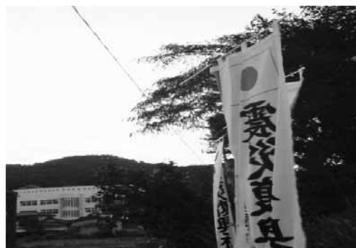
天照御祖神社例大祭の旗