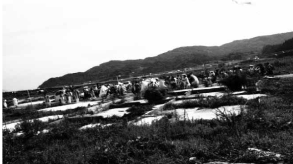
天照御祖神社例大祭の練り歩きの様子

今回発行する冊子はボランティアセンター他、シンポジウムやオープンキャンパスで配布予定だが、より多くの方に手にとってもらうためにはどのようにすればよいかということが今後の課題である。吉里吉里地区においても、明治学院との交流が深い方などには配布が容易であるが、あまり交流のない方などには配布が困難であるため、どのように配布するか考えていきたい。また、記事も交流の深い方が中心となってインタビューをおこなっていったため、限定されたインタビューとなってしまった。交流がなくとも吉里吉里で暮らす方は多くいるため、そういった方々にもスポットを当て全国に発信していきたい。