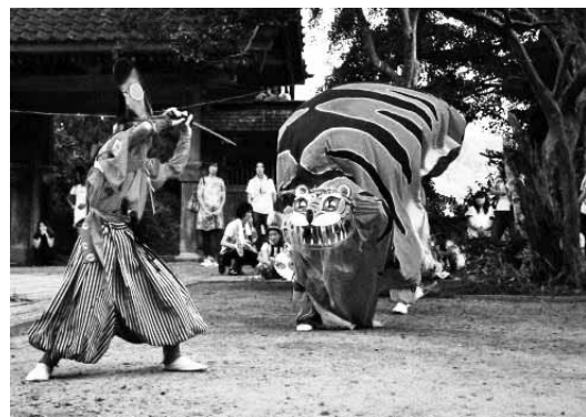
郷土芸能の一つ吉里吉里虎舞講中