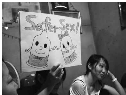
あちょみだ自慢のイラスト紙芝居

企画を進めるうえで心がけていたことは、決して“一方的な知識の押し付け”で終わらせないことである。限られた時間のなかでの確に彼女たちのニーズに応えるため、一人ひとりの性に対する異なる意識や抱えている悩み、不安などを聞くことを最優先とした。堅苦しく難しい講義のようにせず、紙芝居を用いた〇×クイズや手書きのイラストを解説に使用することで女性の身体に関するデリケートな疑問も皆で共有しながら解決できる場となった。この活動はタイ北部のごく一部地域でのことだが、自身の性について正しい認識を持ち、自信を持って周囲に発信できるリーダーを育成することに繋がる。やがて私たちや、彼女たちが下の世代へ知識を受け継ぐようになったとき、それは大きな力となるに違いない。そう実感できたプロジェクトであった。