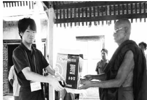
実際の寄付の様子