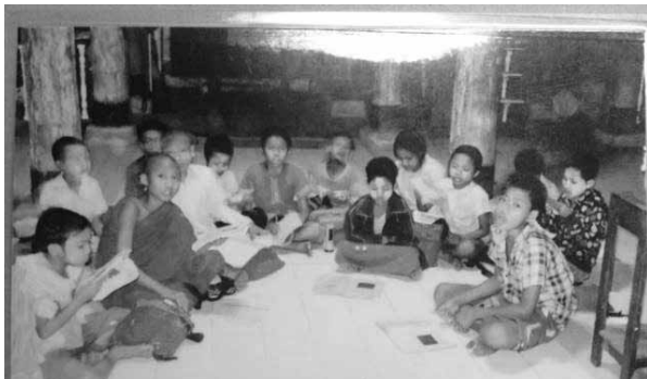
電気の下で勉強する子どもたち

2013年9月、2回目の現地訪問。2月の訪問から実際にどのように使用されているのか、本当に変化があったのか、どのような変化があったのか、確認ができていなかったのが懸念であった。そのため2回目の訪問は事後調査を主な目的として訪問した。実際に、僧侶、先生、子どもたちにインタビューしたところ、「生活面、勉強面でできることが増えた」「いつでも（夜や暗いときでも）勉強できるようになった」「先生の話をよく聞くようになった」「生活が楽しくなった」などという言葉が言ってもらえることができ、電気寄付前に比べるとプラスの効果があったことが伝えられた。また、実際に使用しているところも見ることができ、寄付したものが実際に役に立ち、彼らの生活に少しでも貢献できたと実感し、何より彼らから感謝の言葉をいただいた時のことは、とても印象的でうれしく感じた。この企画の目的であった、必要な電氣量を賄うことができ、「子どもたちの学習環境の改善」は十分に達成できたと考えられる。