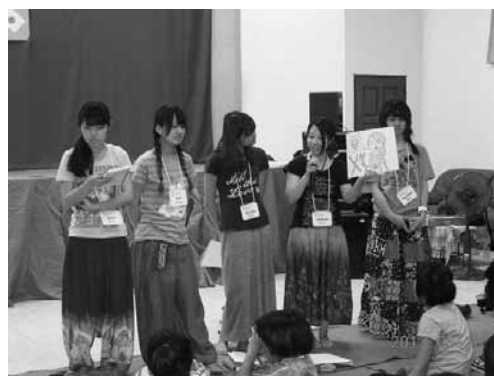
Y M C A パヤオセンターでの企画の様子