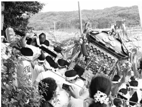
祭の神輿が神社の階段を駆け上る

次に過去の津波経験による教訓では「百日復興」と「命てんでんこ」という二つの教訓を掲載した。この二つの教訓は昭和8年の津波の経験を、地域の人が伝えているものである。この教訓を掲載した理由は、今回の震災において過去の教訓が生かされなかったという吉里吉里人のお話を聞き、吉里吉里内外へ教訓を広めることによって次の津波において生かしてもらいたいと思ったからである。災害の多い日本において、過去の教訓を生かすことによって救われる命が一つでも増えるように、そして復興が進み被災地と呼ばれる地域に住む人々が元の生活を早く取り戻せるように、そんな思いでこの二つの教訓を掲載すると決めた。