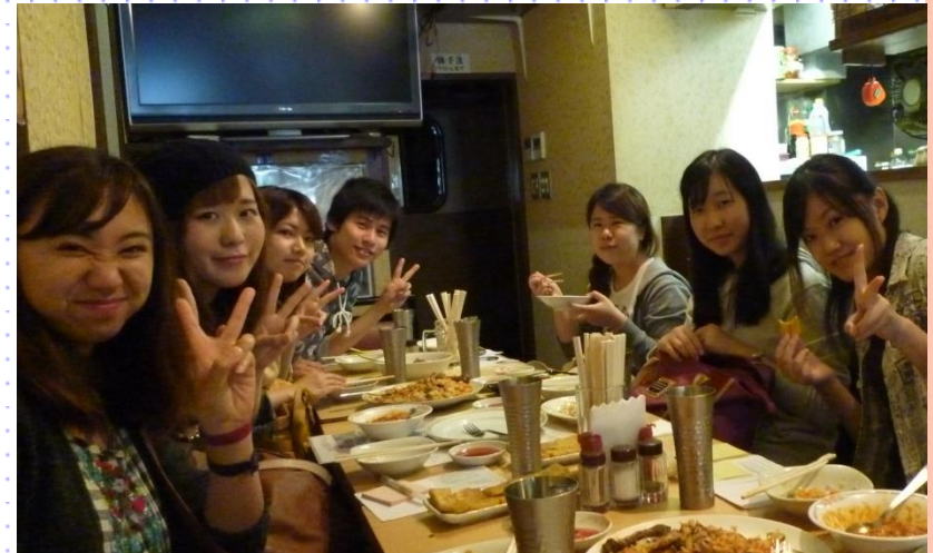
No.43 公益社団法人 難民起業サポートファンド 難民の方が経営するレストランを訪問。ミャンマー料理を食べながら交流&意見交換