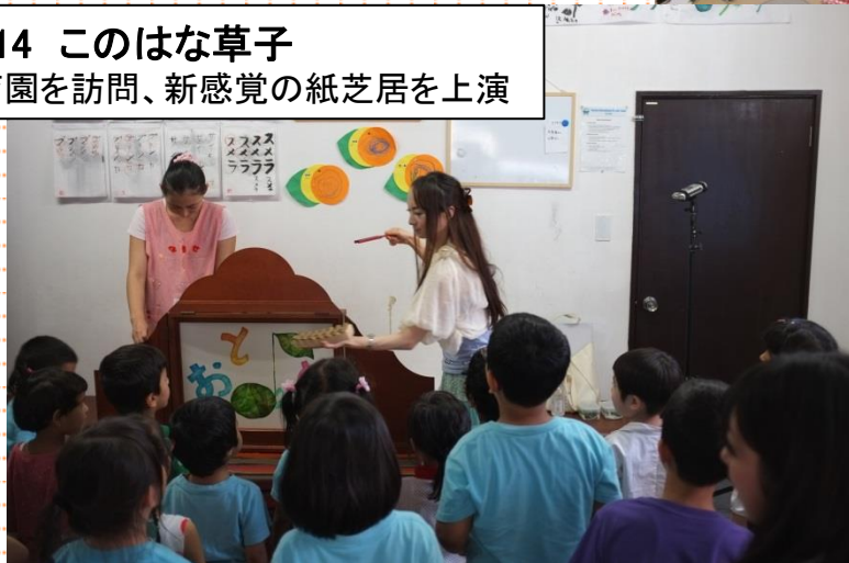
No.14 このはな草子 保育園を訪問、新感覚の紙芝居を上演