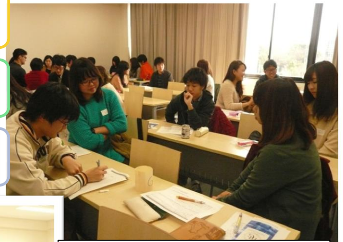
リーダー学生同士の交流会 →広報活動のアイデアを出し合う