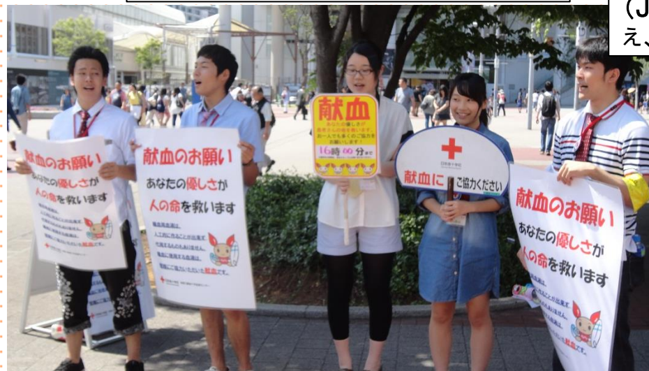
No.25日本赤十字社神奈川県支部 街頭で献血への協力を呼びかけ