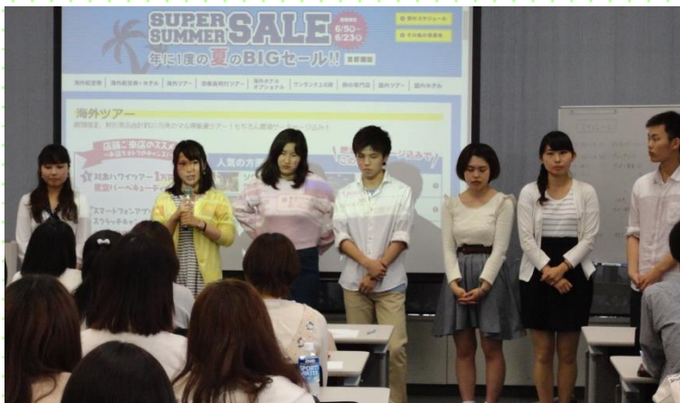
No.53 株式会社 エイチ・アイ・エス グループごとにテーマ別のツアーを企画。H・I・S本社にてプレゼンテーションを実施