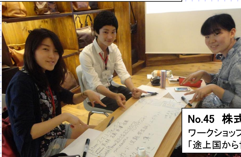
No.45 株式会社マザーハウス ワークショップでバックや小物のデザイン案を作成。 「途上国から世界に通用するブランドをつくる」という理念を体感