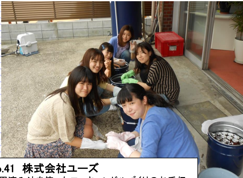
No.41 株式会社ユーズ 使用済み油を使ったエコキャンドルづくりのお手伝い。キャンドルを入れるビン(リサイクル)を洗浄