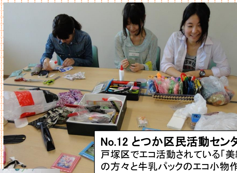
No.12 とつか区民活動センター 戸塚区でエコ活動されている「美織会」 の方々と牛乳パックのエコ小物作り