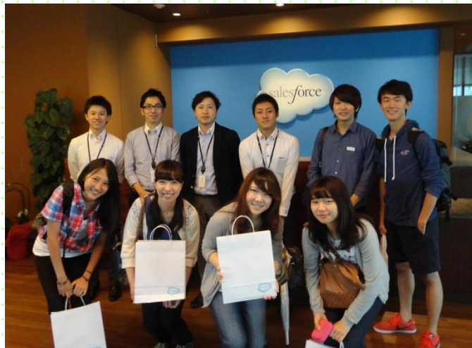
No.61 株式会社セールスフォース・ドットコム 丸の内のオフィス訪問。IT企業が行う社会貢献活動についてお話を聞き、食品梱包ボランティア活動に参加