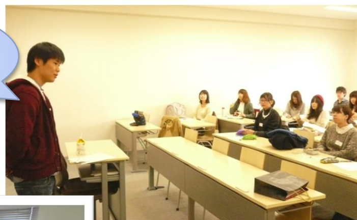
運営委員がリーダー学生を統率、サポート