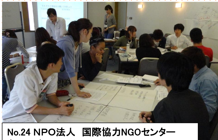
No.24 NPO法人 国際協力NGOセンター (JANIC)グループワークで世界の貧困の原因を考え、 解決のためのプロジェクトを立案