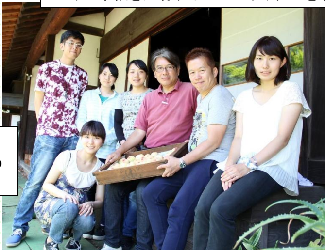
No.62 株式会社 横浜ビール 直営レストランで提供する地元農産物のうち、横浜地域の生産者(桃農園)を訪問