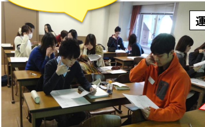
マナー研修を受講するリーダー学生 →ロールプレイングで電話の掛け方を練習