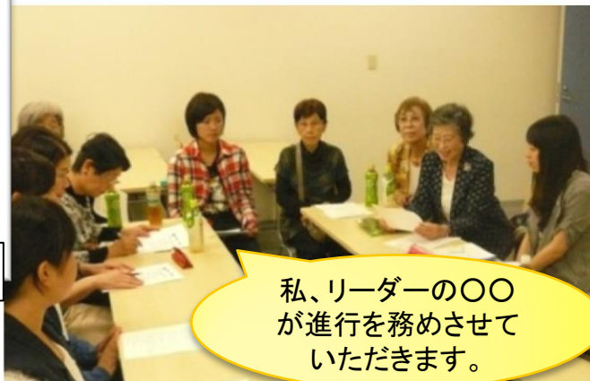
事前学習にて受入先の方と意見交換(例)