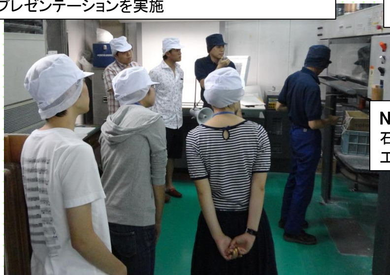
No.54 株式会社 大川印刷 石油の成分を含まない環境に優しいインクを使用した印刷工場を見学。地域とのつながりやCSRについて学習