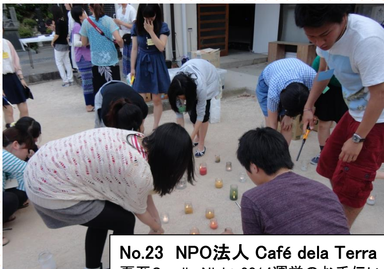
No.23 NPO法人 Café dela Terra 夏至Candle Night 2014運営のお手伝い。 キャンドルに火を灯してイベントの準備

コース②: 世界・環境を支える活動を体験！ 【ボランティア(国際協力・自然・環境など)】