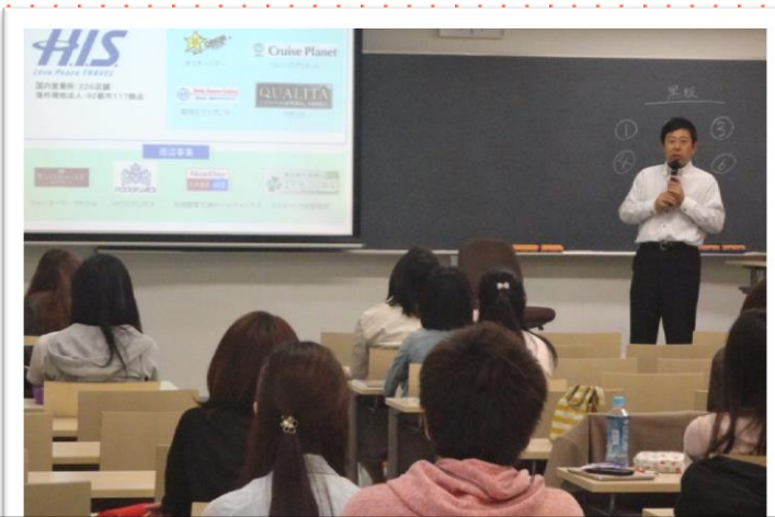
事前学習にて受入先の担当者の講義(例)