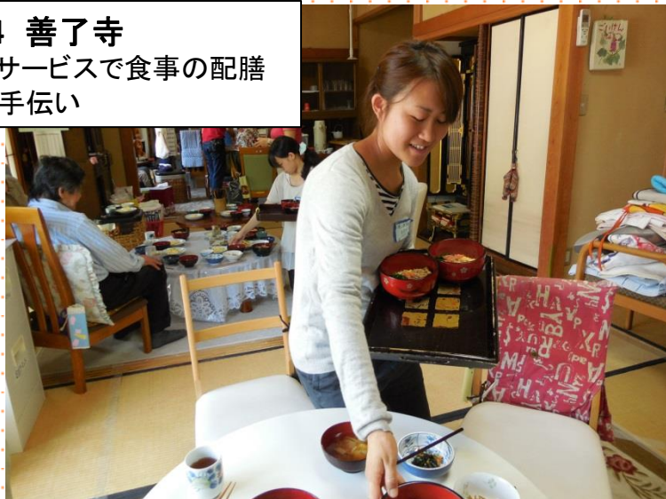
No.4 善了寺 デイサービスで食事の配膳 のお手伝い