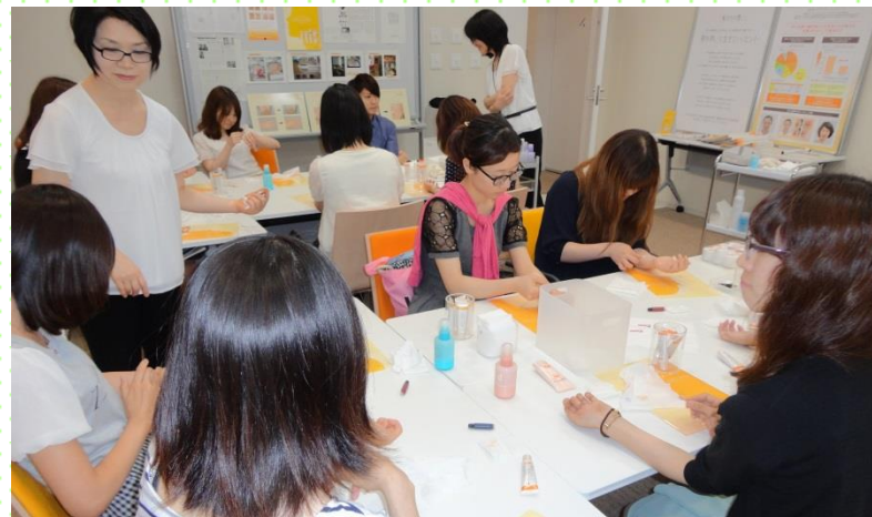
No.52 株式会社 資生堂 アザや白斑などの肌に悩みを持つ方向けのカバーメイクを体験