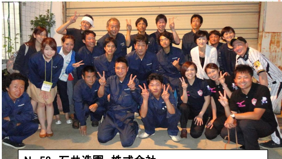
No.58 石井造園 株式会社 CSR報告会の受付や会場の設置のお手伝い。 地域と幸福を共有するCSRの取り組みを学習